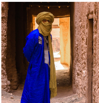
Restaurante de Arwa p. 4

Crossover Global busca apasionadamente glorificar a Dios mediante la plantación de iglesias multiplicadoras entre los pueblos no alcanzados del mundo.