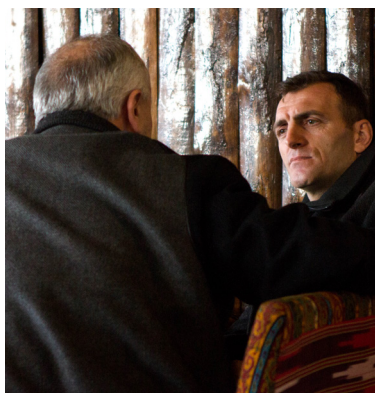
Creciendo espiritualmente fuerte p. 12