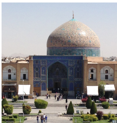
Sueños y Visiones p. 8